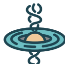
黑洞組 先鋒 On-Sight 極限能力在 5.12a 以上